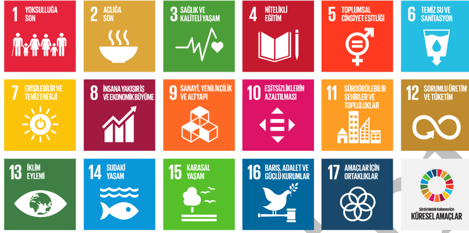
Şekil 3. ESG Kriterleri